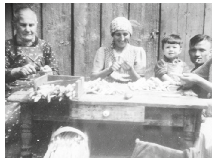
Aufbereitung, Zuschneiden und Sortieren war zumeist die Arbeit älterer Frauen, die nicht mehr auf en Acker gehen konnten. Der Autor mit seinem Vater sah zu (Foto um 1940).

Absatz gab es in den nahen Großstädten Frankfurt und Darmstadt. In der damaligen Selbstversorgerlandwirtschaft waren die Mägen zwar immer gefüllt, aber die Portemonnaies leer. Die Nettoerlöse waren bescheiden und so war die Ernte fast ausschließlich Frauenarbeit, die neben der Versorgung von Haus, Hof und Familie anfiel. Dieser Nebenerwerb war aber nur möglich, weil in der noch weitgehend intakten Dorfgesellschaft viele Bekannte und Verwandte oft gegen bescheidenen Lohn oder nur für das Essen mithalfen.