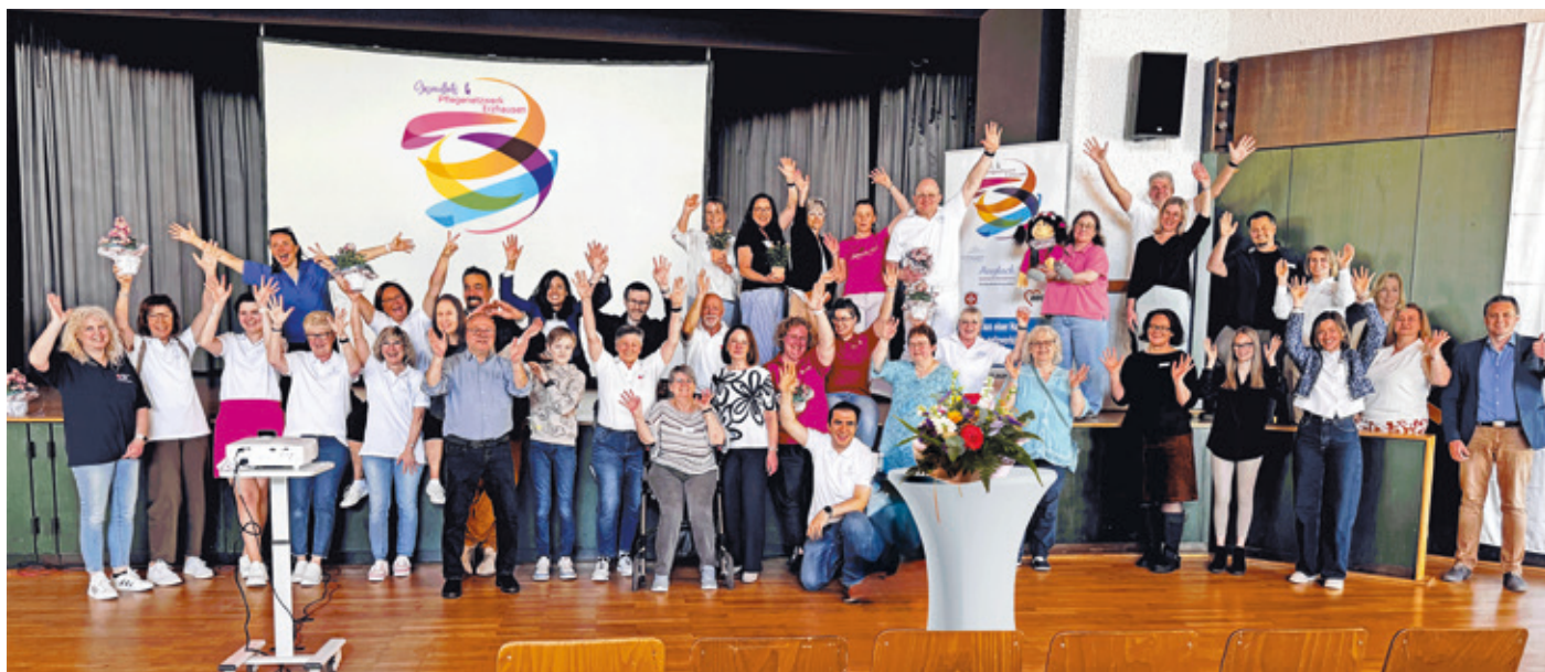
Die Beteiligten aus dem Gesundheits- & Pflegenetzwerk Erzhäuser.

Wissen, Austausch und Unterstützung standen im Mittelpunkt eines lebendigen Nachmittags im Bürgerhaus Erzhäuser