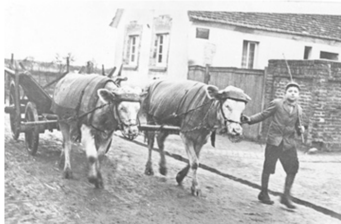
Kuhfuhrwerk eines Kleinbauern in der Brühlstraße (Foto um 1937).

Spargelanbau war von Anfang bis Ende mühsame Handarbeit. Zunächst mussten die etwa einen halben Meter tiefen Gräben mit Spaten und Schaufel ausgehoben und nach der Bepflanzung in den folgenden Jahren allmählich wieder zugeschaufelt werden. Für den Bleichspargel wurden dann Erddämme, die Spargelbalken, über den Pflanzreihen aufgeworfen. Dies geschah mit Pflügen und in Handarbeit. Besonders mühsam war das Runden der Spargelbalken. Dazu wurde ein Sack an beiden Enden mit Sand gefüllt und wie Packtaschen beim Pferd über den Spargelbalken geworfen. Zwei Personen zogen dann den Sack mehrfach den Balken entlang. Nach Johannis wurden die Balken zur Verbesserung des Wachstums der grünen Sprosse wieder auseinander gepflügt. Mit der Handsense wurde das braune Kraut im Spätherbst gemäht und vor Ort verbrannt. Heute wird es zerkleinert und als Mulch zur Bodenverbesserung untergebracht.