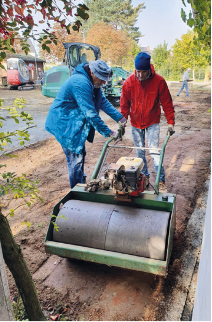
Schweres Gerät im „Boulodrome“ der SGA.

Arheilgen (kt). In den letzten Wochen ging es hoch her bei den Bouler/-innen der SGA – schweres Gerät war im Einsatz und ganz viel Handarbeit war angesagt. In den letzten Jahren hatten sich einige Boule-Bahnen so stark verdichtet, dass das Regenwasser nur noch sehr langsam abfließen konnte. In der vergangenen Saison führten die großen Pfützen z.T. zu erheblichen Einschränkungen im Spielbetrieb. Der aufmerksame Leser wird sich sicher an unsere „Schlamm Schlacht“-Berichte erinnern. Bei den betroffenen Bahnen wurden zunächst 20cm „Alt-Belag“ entfernt und auf den „Auto-Stellplätzen“ verteilt. Fachgerecht wurden dann Woche um Woche drei verschieden dicke Schichten