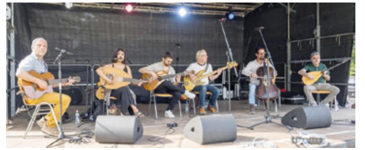
Tosender Beifall für die Gruppe „Salon Erika“, gesponsert von der Darmstädter Bürgerstiftung bei der Kranichsteiner „Bunte Wiese“.

Kranichstein (hv). Bei herrlichem Sommerwetter, außergewöhnlichem Besucherandrang und bester Stimmung fand am vergangenen Samstag mitten in Kranichstein das 23. Internationale Kranichsteiner Stadtteilfest „Bunte Wiese“ statt. Das zweitgrößte internationale Fest Darmstadts zog zahlreiche Besucherinnen und Besucher an und setzte erneut ein starkes Zeichen für Vielfalt, Zusammenhalt und gelebte Integration.