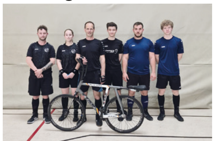
Von rechts nach links: Arheilgen 1, Arheilgen 2, Arheilgen 3.

Arheilgen (dd). Am vergangenen Samstag fand in Naurod der letzte Spieltag der Radball-Verbandsliga statt. Mit drei Mannschaften war die SG Arheilgen vertreten und kämpfte um wichtige Punkte für die Abschlusstabelle. Dabei lagen Freude und Enttäuschung bei den Arheilger Teams dicht beieinander.