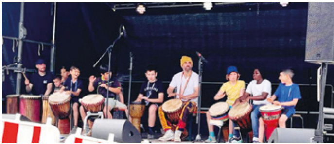
Für einen dynamischen und stimmungsvollen Start bei der Kranichsteiner „Bunte Wiese“ sorgten die Kinder des städt. Kinderhorts Jägertorstraße.

Ungewöhnlich große Beteiligung und super tolles Wetter – Kranichsteiner aus aller Welt feiern gemeinsam, fröhlich und ausgelassen beim 23. Internationalen Kranichsteiner Stadtteilfest