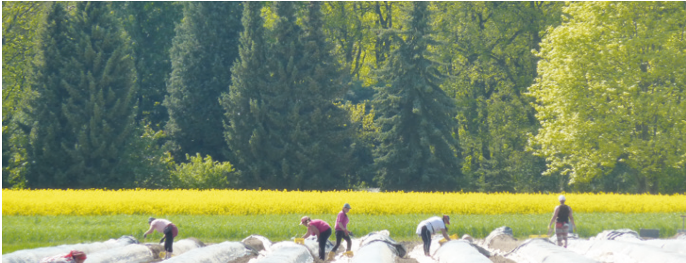
Spargelernte unter Folien am Nachwald (Foto 2020).