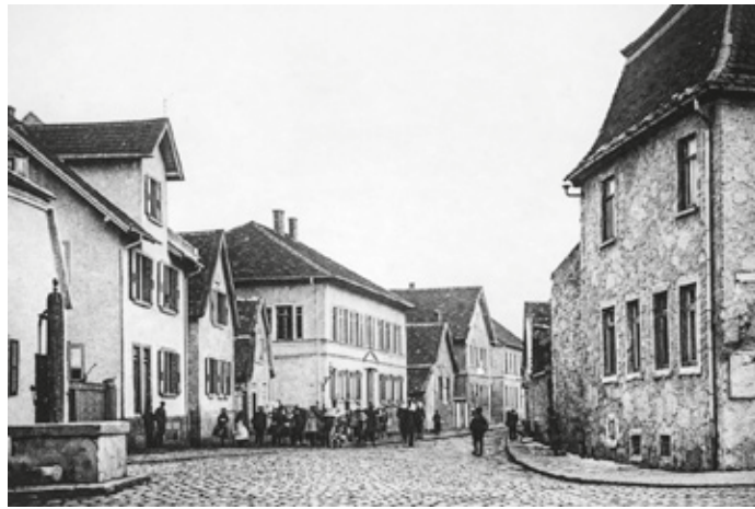
Blick von Westen in Höhe der Darmstädter Straße in die Dieburger Straße, spätere Messeler Straße. Im Vordergrund steht die Roßpumpe. In der Mitte des Bildes ist das 1840 errichtete Rathaus zu sehen. Das erste Rathaus in Arheilgen wurde bereits Ende des 16. Jahrhunderts errichtet.

Arheilgen (jhb). Die Messeler Straße ist Arheilgens Hauptverkehrsader in Ost-West-Richtung. Früher hieß sie Dieburger Straße. Sie verbindet und durchläuft das frühere Ober- und Unterdorf, aus denen Arheilgen entstanden ist. Zwischen dem alten Zollhaus - der Schreiberpforte - im Westen und den Flachbauten der Arheilger Gemeindefiedlung beim heutigen Mucker-Haus im Osten liegen die Zehntscheuer, das Pfarrhaus und die Auferstehungskirche.