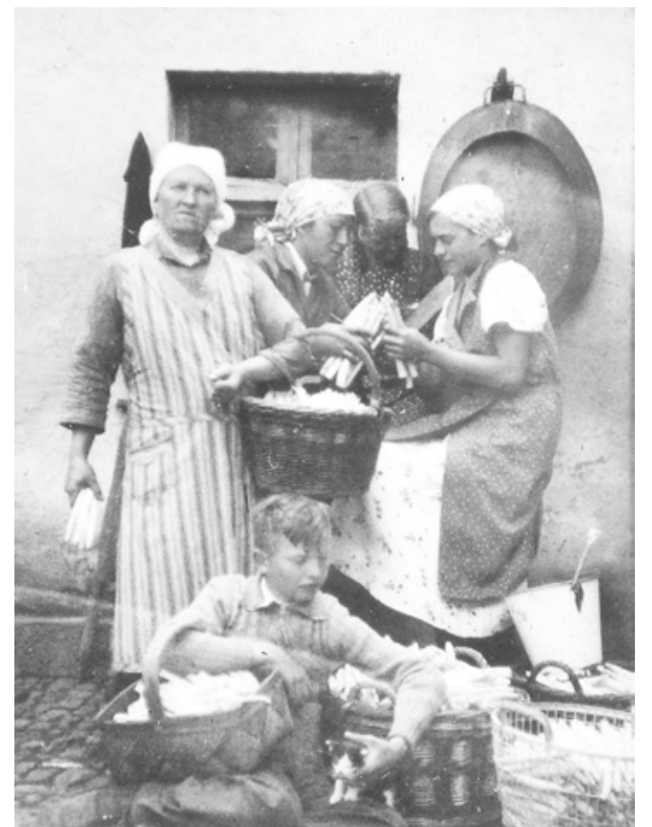
Bei der Ernte und beim Zubereiten der Spargel zum Verkauf halfen selbstverständlich auch die Jugendlichen mit (Foto um 1939).