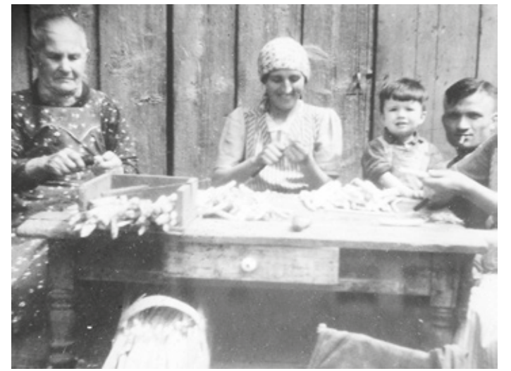
Aufbereitung, Zuschneiden und Sortieren war zumeist die Arbeit älterer Frauen, die nicht mehr auf en Acker gehen konnten. Der Autor mit seinem Vater sah zu (Foto um 1940).

Spargelanbau war von Anfang bis Ende mühsame Handarbeit. Zunächst mussten die etwa einen halben Meter tiefen Gräben mit Spaten und Schaufel ausgehoben und nach der Bepflanzung in den folgenden Jahren allmählich wieder zugeschaufelt werden. Für den Bleichspargel wurden dann Erddämme, die Spargelbalken, über den Pflanzreihen aufgeworfen. Dies geschah mit Pflügen und in Handarbeit. Besonders mühsam war das Runden der Spargelbalken. Dazu wurde ein Sack an beiden Enden mit Sand gefüllt und wie Packtaschen beim Pferd über den Spargelbalken geworfen. Zwei Personen zogen dann den Sack mehrfach den Balken entlang. Nach Johannis wurden die Balken zur Verbesserung des Wachstums der grünen Sprosse wieder auseinander gepflügt. Mit der Handsense wurde das braune Kraut im Spätherbst gemäht und vor Ort verbrannt. Heute wird es zerkleinert und als Mulch zur Bodenverbesserung untergebracht.