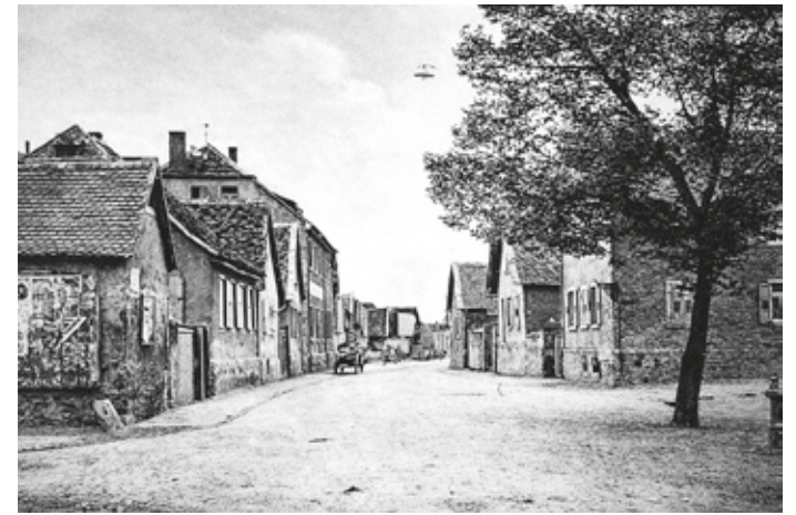
Blick von der Balserpumpe in die Dieburger Straße um 1916. Links mündet die Untere Mühlstraße in die „Dieburger“. An der Ecke zur Oberen Mühlstraße ist das ursprüngliche Haus der Schreinerei Luther zu sehen. Vor ihren Umzug an die „Dieburger“ hatte die Schreinerei ihren Sitz in der heutigen Lutherstraße.