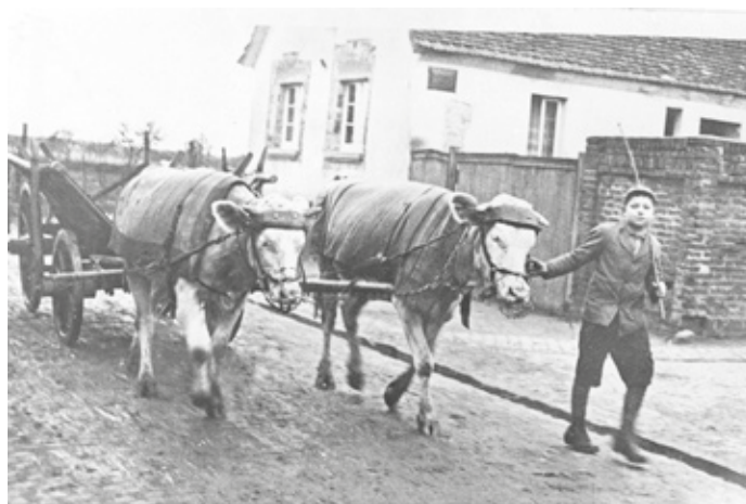
Kuhfuhrwerk eines Kleinbauern in der Brühlstraße (Foto um 1937).

Erzhausen war bis in die ersten Jahre nach dem letzten Weltkrieg ein Dorf der Arbeiter und kleinen Arbeiterbauern. Vollerwerbsbetriebe gab es einige wenige. Die Kleinbauernwirtschaft war ein krisenstabiles Wirtschaftsmodell. Etwas Bargeld verdiente man durch den Beruf außerhalb. Die kleine Landwirtschaft, oft mit Kühen als Zugtiere, sorgte für die Grundversorgung mit Lebensmitteln und bewahrte vor Hunger. Je nach Konjunktur konnte man den Schwerpunkt auf das eine oder das andere Strandbein verlegen. Dramatisch wurde die Situation nach dem Ersten Weltkrieg als die allgemeine Verarmung durch die Inflation und die Arbeitslosigkeit noch beschleunigt wurde.