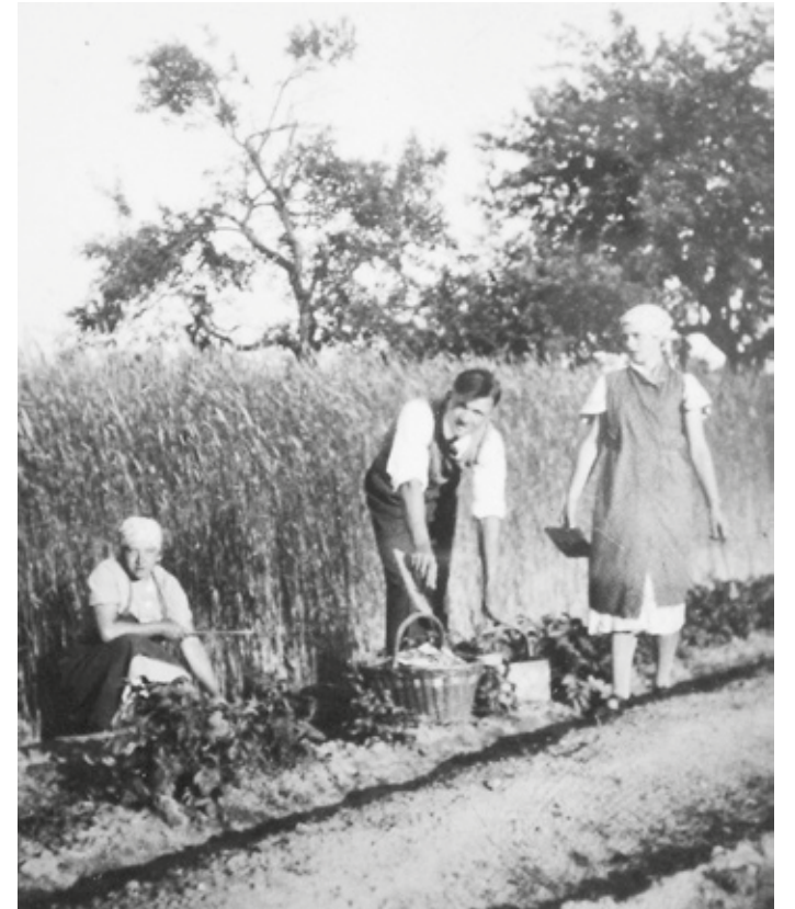
Manchmal halfen auch Männer bei der Ernte nach ihrer Berufsarbeit mit (Foto um 1939).

Absatz gab es in den nahen Großstädten Frankfurt und Darmstadt. In der damaligen Selbstversorgerlandwirtschaft waren die Mägen zwar immer gefüllt, aber die Portemonnaies leer. Die Nettoerlöse waren bescheiden und so war die Ernte fast ausschließlich Frauenarbeit, die neben der Versorgung von Haus, Hof und Familie anfiel. Dieser Nebenerwerb war aber nur möglich, weil in der noch weitgehend intakten Dorfgesellschaft viele Bekannte und Verwandte oft gegen bescheidenen Lohn oder nur für das Essen mithalfen.