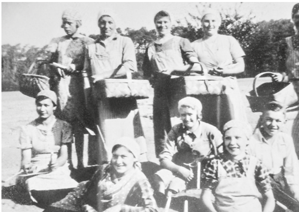
Die Spargelernte war fast ausschließlich Frauenarbeit (Foto um 1939).

Ein Exkurs: Geologisch gesehen stammen die Sandfelder aus der letzten Eiszeit, die vor etwa 15.000 Jahren zu Ende ging. Die Rheinebene war eine breit vom Rhein durchzogene eisige Kältsteppe. Die kalten Winde fegten die aus den Flussablagerungen ausgewehten Sande zu Dünen zusammen, welche, obwohl niedrige Hügel, unseren Vorfahren in der topf-ebenen Landschaft wie Berge erschienen. In der Erzhäuser Gemarkung gibt es als Gewanne den Schellenberg, den Galgenberg und den Ohlenberg. Der Heegberg ist zwar die höchste Düne der Umgebung und der gefühlte Hausberg der Erzhäuser – er gehört aber zur Egelsbacher und Mörfelder Gemarkung.