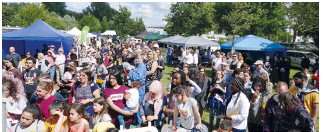
Vor der Bühne beim Kranichsteiner Stadtteilfest „Bunte Wiese 2025“.

Kranichstein (hv). Der Förderverein Kranichstein e.V. lädt am Samstag, 30. Mai 2026, von 14 bis etwa 19 Uhr zur 23. Internationalen „Bunte Wiese“ auf die Brentanowiese im Herzen Kranichsteins ein. Das beliebte Stadtteilfest steht erneut ganz im Zeichen von Begegnung, Vielfalt und interkulturellem Austausch. Ein besonderes musikalisches Highlight erwartet die Besucherinnen und Besucher in diesem Jahr zum Abschluss des Festes: Anlässlich ihres 50-jährigen Bestehens unterstützt die Bürgerstiftung Darmstadt die Auftritte zweier international besetzter Bands. Ab 17 Uhr geht es los mit der Gruppe „Soundkitchen“ – mit ehemaligen Mitgliedern der „Besidos“ sowie Musikerinnen und Musikern des Darmstädter Staatstheaters – diese präsentieren Balkan-Pop und Weltmusik, die Kulturen verbindet. Ebenfalls auf der Bühne steht „Salon Erika“ mit einer Mischung aus Shanty-Pop und Polka-Beats,