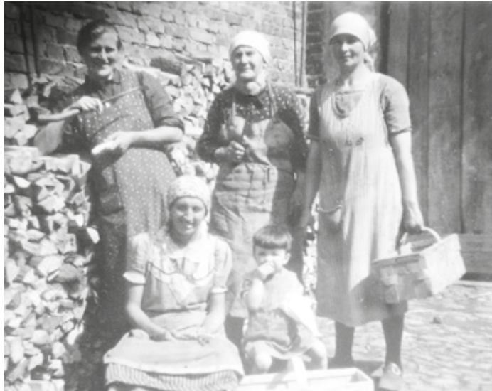
Meist halben Bekannte und Verwandte mit (Foto um 1939).

Sofern nicht anders angegeben, sind alle genannten Veranstaltungen kostenfrei und richten sich an Bürgerinnen und Bürger, die über 65 Jahre alt sind und in Darmstadt leben. Für alle Veranstaltungen ist eine Anmeldung während der jeweiligen Anmeldefristen notwendig. Anmeldungen und Fragen zu den Veranstaltungen nimmt die Servicestelle Soziales und Beratung entgegen (Telefon: 06151 13-2872; E-Mail: sub-programm@darmstadt.de ).