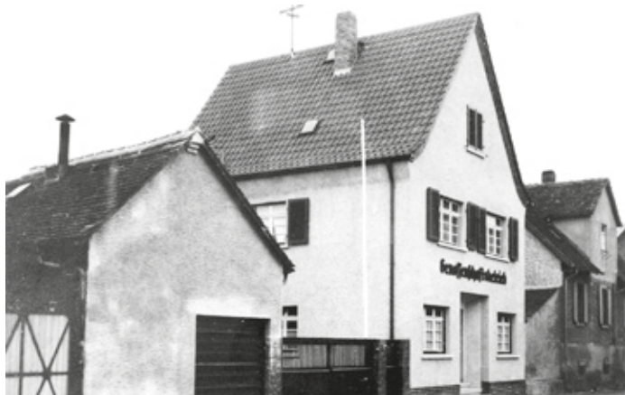
Die Gummernbank 1939, Rheinstraße 1.

Der Anbau in Erzhausen kam völlig zum Erliegen, als es keine mithelfenden Arbeitskräfte mehr gab und viele Voll- und Nebenerwerbslandwirte ihre Betriebe aufgaben. Das boomende Wirtschaftswunder bot bessere Verdienstmöglichkeiten. Erst der Maschineneinsatz, ausländische Arbeitskräfte und die Erschließung von größeren Käuferschichten für dieses einmalige Luxusgemüse haben zu dem aktuellen Anbauboom geführt. An die alten Zeiten erinnert noch die Vorliebe älterer Erzhäuser für Spargelgemüse in einer hellen Soße. Heute gibt es keine Spargelbetriebe mehr am Ort, sondern nur von Landwirten aus Nachbargemeinden.