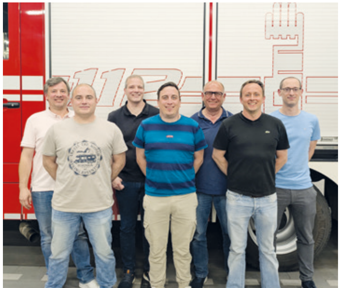
Der neu gewählte Vorstand des Vereins der Arheilger Feuerwehr.

Arheilgen (db). Am vergangenen Donnerstag, den 30. April 2026, trafen sich die Mitgliederinnen und Mitglieder der Freiwilligen Feuerwehr Darmstadt-Arheilgen (FFA) zu den Jahreshauptversammlungen der Dienstabteilungen und des Feuerwehrvereins.