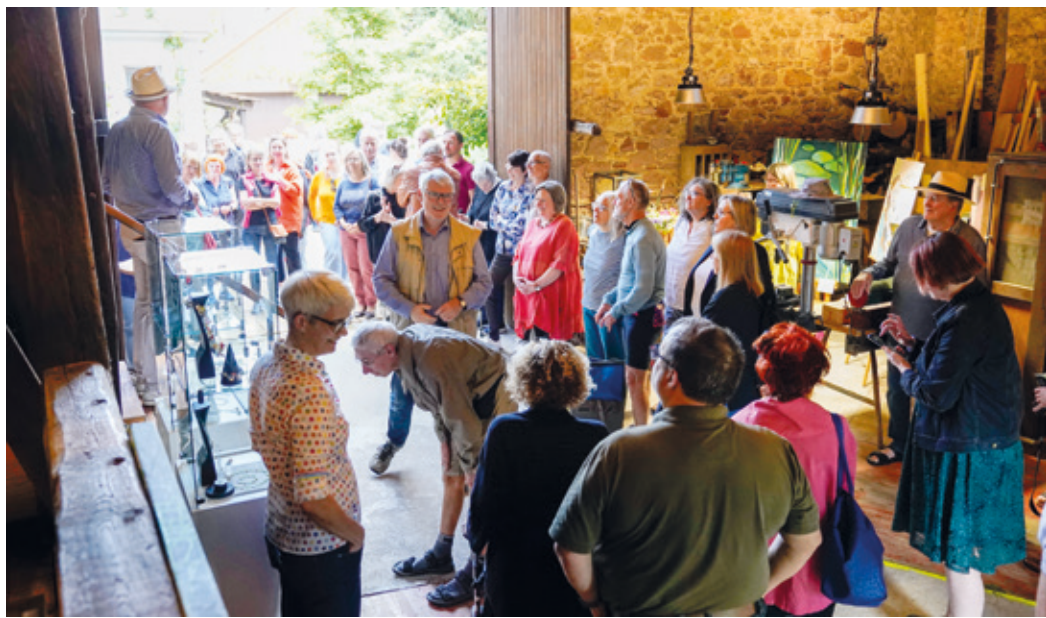
SchuppenArt bei der Eröffnung im Jahr 2024.

Zur Ausstellung am Himmelfahrt in die Scheunengalerie