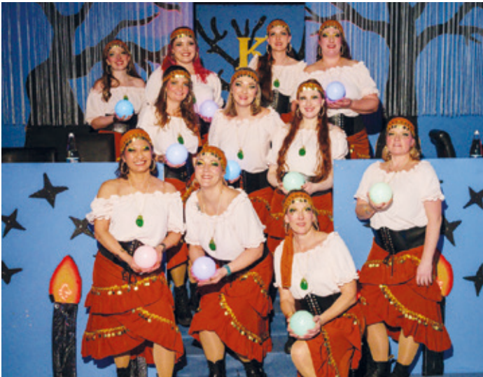
KCA-Damenelferrat als Wahrsagerinnen.

Die Blindschleichen aus Wixhausen begeisterten mit ihrem Jubiläumsauftritt „Wir feiern 11 Jahre Blindschleichen“ das Publikum. Im Takt der Musik folgten mit der Männergarde und der Real-mengroup aus Griesheim weitere tanzstarke Auftritte.