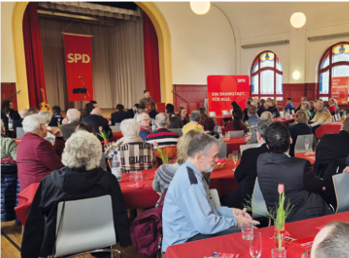
Voll besetzter Saal im Goldnen Löwen beim Neujahrsempfang der Arheilger SPD am 25. Januar.

Volles Haus und volle Kraft in Richtung Kommunalwahl