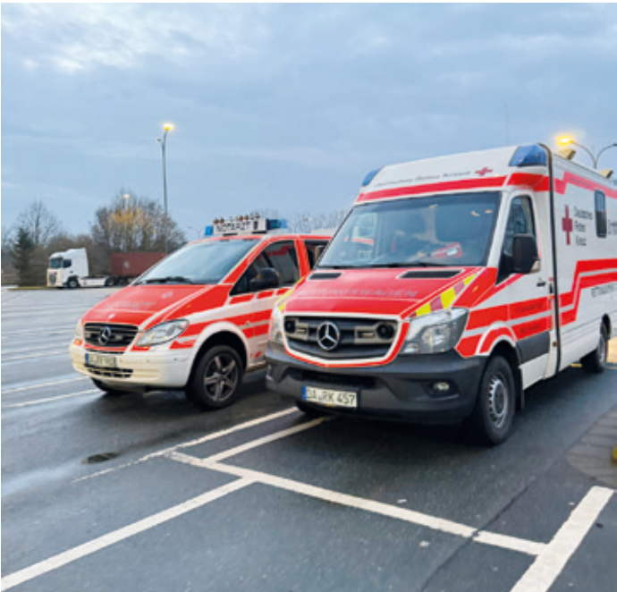
Mit dem Notarzteinsetzfahrzeug und Rettungswagen für alle Fälle gerüstet: Auch wenn Bombenentschärfungen in der Regel ohne Komplikationen vorstattengehen, sind Sicherheitsvorkehrungen unabdingbar. Dazu zählt die medizinische Sicherheit.

Darmstadt (as). Die Bereitschaften des DRK-Kreisverbands Darmstadt-Stadt e.V. stellen fünf Katastrophenschutzeinheiten des Landes Hessen. Drei davon – der 1. Sanitätszug im DRK-Ortsverein Arheilgen sowie der 1. Betreuungszug im DRK-Ortsverein Darmstadt-Mitte und der 2. Betreuungszug im DRK-Ortsverein Eberstadt – unterstützten mit 41 ehrenamtlichen DRK-Einsatzkräften am 1. Februar die Evakuierungsmaßnahmen rund um den Bombenfund am Nordbahnhof. Insgesamt fielen bei diesem Einsatz rund 420 Ehrenamtsstunden an.