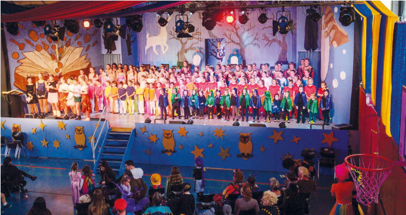
Zahlreiche Aktive auf der Bühne der Familiensitzung des KCA.