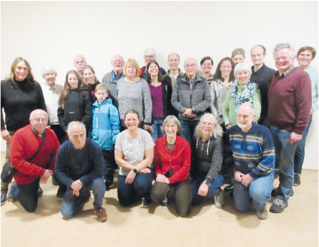
In angeregter Unterhaltung wurde ein positives Resümee der vergangenen Monate und Wochen gezogen; somit klang der Abend aus und beendete die Sportabzeichensaison 2024.

Abschließend bedankte sich Sportabzeichen-Treff-Leiter