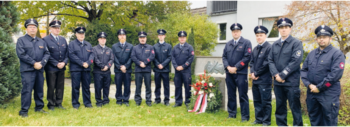
Kranzniederlegung der Feuerwehr 2024.