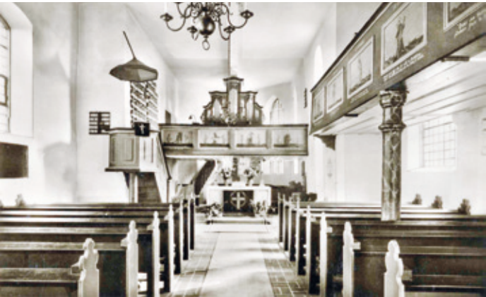
Die Kränze für die Gefallenen in der ev. Kirche links oben.

Viele taten sich schwer, ihre Teilnahme an dem verbrecherischen Krieg eines Diktators danach in einer demokratischen Gesellschaft zu erklären. Oder: Wie geht man mit den Toten, die im Krieg eines Diktators gestorben sind in einer Demokratie um? Auch ein Thema für den runden Tisch.